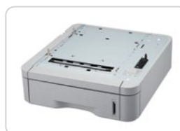
Bandeja Opcional ML-S5010A