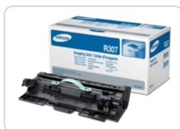
Unidade de Imagem ML-R307