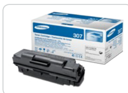
Cartucho de Toner Preto Toner Inicial ML-TD307S