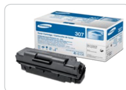
Cartucho de Toner Preto Alta Durabilidade ML-TD307L/E