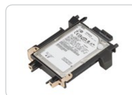
Disco Rígido ML-HDK470 (Somente ML-5010ND/5015ND)