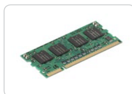
Memória de 512MB ML-MEM170