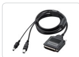
Conector Paralelo ML-PAR100