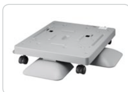
Gabinete Baixo ML-DSK65S (Somente ML-5010ND/5015ND)