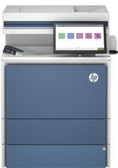
Impressora HP Color LaserJet Enterprise Flow MFP X57945z

Essa impressora destina-se a funcionar somente com cartuchos que tenham um chip da HP novo ou reutilizado e aplica medidas de segurança dinâmica para bloquear cartuchos que usem um chip de terceiros. As atualizações periódicas de firmware manterão a eficácia dessas medidas e bloquearão cartuchos que funcionaram anteriormente. Um chip da HP reutilizado permite a utilização de cartuchos reutilizados, remanufaturados e recarregados. Para mais informações, acesse a: http://www.hp.com/learn/ds